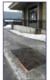
Il y a eu non remplacement d'un arbre depuis plus de deux ans pour la photo de gauche (face au 1031, Promenade Fleury) et depuis au moins cinq ans rue Lajeunesse, photo de droite. À l'époque, il y avait un grand arbre en face de la Rôtisserie St-Hubert.

Johanne Aubry Comptable Impôts et Tenue de Livres