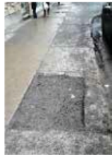
Il y a eu non remplacement d'un arbre depuis au moins cinq ans en face du 1375A, Promenade Fleury.

« Le quartier dans lequel j'ai choisi d'habiter il y a une vingtaine d'années ne ressemble plus du tout à ce qu'il était. On l'a énormément déboisé. Pourtant, nous avons adopté il y a plusieurs années le plan canopée qui prévoyait un rehaussement de la canopée. On semble maintenant l'avoir oublié », déplorait-il.